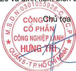
ĐẶNG ANH TÂM

Ban Kiểm phiếu cam kết tính trung thực của biên bản này. Biên bản được lập lúc 10 giờ 00 ngày 30/05/2020 và đính kèm biên bản Đại hội đồng cổ đông tài khóa 2019 ngày 30/05/2020.